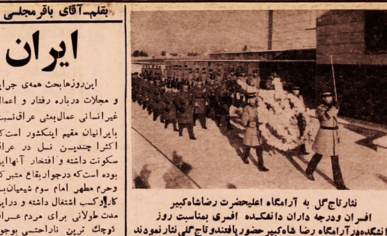
نثار گل بر آرامگاه علیاحضرت رضاشاه کبیر افغان و درجه داران دانفکده آفری بمناسبت روز دانفکده در آرامگاه رضا شاه کبیر حضور یافتند و نثار گل نمودند

روزنامه کوشش در آستانه سال جدید روزنامه کوشش سال پنجاه و هفتم در وقت آمیز خود با پرچم با توجه و تألیف عالی معنوی و عملی و کسب به سال جدید از یاد نبرده‌است ما همیشه افتخار خواهیم داشت که در راه پریش و خم روزنامه نگاری جز بخود هیچ یک از مقامات ملی و دولتی اکتاء و استظهار مای نداشته بقیه در صفحه ۴