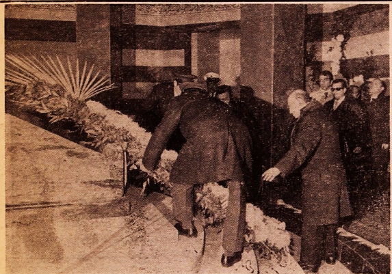
هیئت مرزی ترکیه در حالیکه با نثار گل بر آرامگاه رضاشاه کبیر ادای احترام مینمایند

بناشد یعنی هابمدرسه علوم دینی (سلیمیه) حمله بردند و پس از مجروح کردن خادم مدرسه طلاب مدرسه را زداشت کردند و پس از آزار و شکنجه از عراق روانه ایران کردند و من اعتراض کردم که شما وقتی بخواید یهودی‌ها را بیرون کنید به آنها ۶ ماه فرصت میدهند ولی با مسلمانان ایران اینطور رفتار میکنید!!