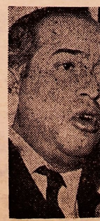
پایان آقای باقر مجلسی

زجر و شکنجه رانده شدگان ایرانی جمعی از آسایان علما و روحانیون و طلاب دینی با اتفاق اعضای خانواده‌هایشان که از نجف کربلا و کاظمین همراه ایرانیان رانده شده از عراق وارد کربلا شده‌اند و دولت و شور و خورشید سرخ در اختیار آنان گذاشته شد در میان بدرقه کرم مردم کرمانشاه دیروز و امروز این شهر را بسوی قمر ترک کردند. طرف دیف و امروز عده دیگری از آقایان علما و روحانیون وارد کرمانشاه شده‌اند و همچنان جامعه روحانیت کرمانشاه هستند بقیه در صفحه ۴