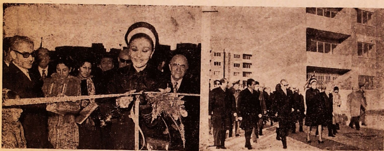
شهبانو در حالیکه کتابخانه پرورش فکری کودکان را افتتاح میفرمایند

ما تعهد میکنیم بفرمان شاهنشاه بزرگ در این جهاد ملی و انسانی یعنی در خدمت بخلق عموما و بویژه در خدمت بهموطنان هم دین خود آتیم در این موقیبت دشوار با تمام وجود خود شرکت کنیم