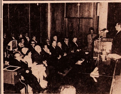
روز گذشته در مراسمی که در سالن کنفرانس اداره مرکزی شرکت ملی نفت ایران با حضور هر دو رهبر از مذاکرات بین المللی در شانگهای برگزار شد. نیکسون و چوئن لای در میان دیگر مقامات دولتی و نظامی در حال گفتگو هستند.

پکن، خبرگزاری فرانسه هواپیمای جت بوئینگ حامل رئیس جمهوری آمریکا و همراهمان و همچنین مقامات رسمی که در شانگهای به آنها پیوسته بودند در فرودگاه پکن بزمن نشست. چوئن لای نخست وزیر جمهوری آمریکا در فرودگاه حضور داشت ساعت ۱۱ بوقت محلی ۱۲۰ نظامی که نماینده سه قسمت ارتش خلق چین بودند در مقابل هواپیمای حامل نیکسون و همراهمان قرار گرفتند. در فرودگاه بجای توده های دهقانان و کارگران دسته هائی از دختران چینی در حال رقص که یکی از سنتهای آنها است دیده میشد، در مسیر فرودگاه پکن تنها عده معدودی گرد آمده بودند و هیچگونه ابراز احساساتی نیز مشاهده نمیشد. نیکسون و چوئن لای در یک اتومبیل لیموزین شیشه های اتومبیل با پرده سیاه پوشیده شده بود. زین به پرچمهای آمریکا و چین قرار داشتند.