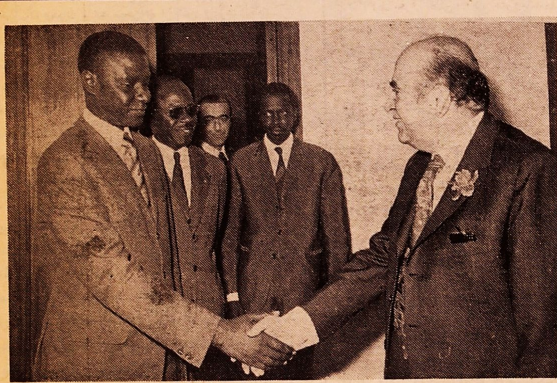
ملاقات هیئت ستعال با آقای هویدا نخست وزیر عکس ها از کانو خبر نگاران عکاس

ریچارد نیکسون رئیس - جمهوری آمریکا که شایسته است را بسوی وطن خود ترک کرد قبل از عزیمت از شایستگی در ضیافتی که وسیله رئیس شورای انجمن شهر بافتسار او برپا شده بود شرکت کرد و ضمن بیان تاهی گفت یک هفته ای که من در کشور شامیهمان بدهان هه هفته بسیار بزرگ و مهمی بود این هفته در واقع چهره دنیا را دگرگون کرد.