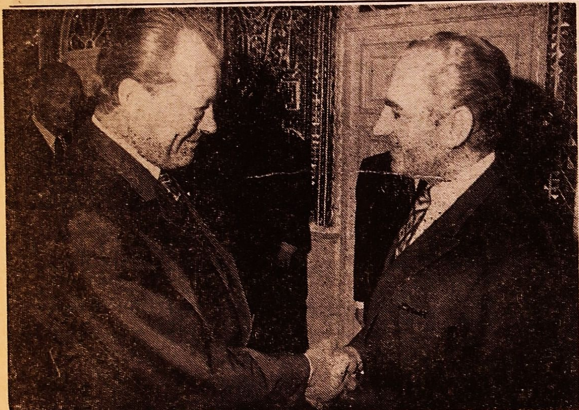
شرقیایی ویلی برانت صدراعظم آلمان فدرال بحضور شاهنشاه آریامهر و مذاکره در زمینه مسائل مورد علاقه دو کشور

اهمیت سیاست اخیر شما در زمینه گشودن باب مر او ده با شرق بخوبی واقف هستند