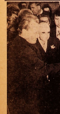
استقبال گرم و صمیمانه آلمانی های مهمی تهران از ویلی برانت صدراعظم آلمان

با درآمد نوسازی نمیتواند برنامه های اصلاحی خود را بجز بخره اجری در آورد و قادر نیست در هر کوی و برزن یک پارک عمومی ایجاد کند و یا دستمزد رفعت را الا اقل به مایه شمس تومان برساند