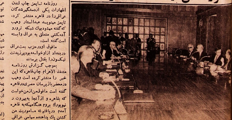
مذاکرات ویلی برانت صدراعظم آلمان با آقای هویدا نخست وزیر در زمینه توسعه روابط بازرگانی و همکاری های اقتصادی

روزنامه تایمز چاپ لندن اظهارات یکی از دستگیر شدگان عراقی را در قاهره منتشر کرد، تایمز می نویسد عبدالستار وهیب که گفته میشود یک شبکه تروریستی آدمکش متعلق به عراق وابسته است گفته است، مافوق او در حزب بعث عراق در بغداد از او خواسته بود در زندان نیکوندا بقتل برساند