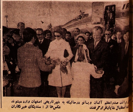
برانت صدراعظم آلمان و بانو در حالیکه به شهر تاریخی اصفهان وارد میشوند استقبال شایان فرامرغ رفتند

بامداد دیر وزیر آلمان در یک اعلامیه مشترک که بمناسبت مسافرت رسمی آقای ویلی برانت صدراعظم جمهوری فدرال آلمان بایران صادر شده تصمیم راسخ خود را به ادامه تالنهایی بگیری برای استقرار یک صلح عادلانه و براد در جهان اعلام داشتند بنا بدعوت جناب آقای امیر عباس هویدا نخست وزیر ایران جناب آقای ویلی برانت صدراعظم جمهوری فدرال آلمان و