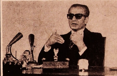
شاهنشاهی آریامهر هنگام پاسخ به سوالات نمایندگان مطبوعات داخلی و خارجی

بعد از ظهر دیر وزیر پیشگاه شاهنشاهی مرکز پژوهش و آزمایشگاههای شرکت ملی نفت ایران در شهری گشایش یافت در این مراسم هیئت دولت رجال و شخصیت های کنوری و لشکری حضور داشتند بدو آقای دکتر اقبال گزارشی معروض و سپس شاهنشاهی