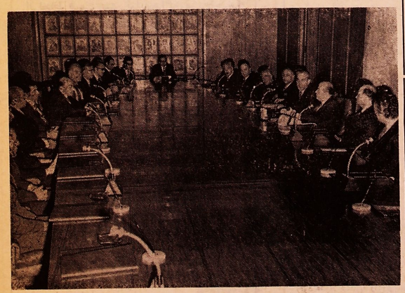
در جلسه معرفی و آشنائی روسای فدراسیون ها آقای هویدا نخست وزیر

نچه در عراق اتفاق می افتد مخالف رو حیات مردم عراق است شرایط موجود در آلمان شرقی برای ما قابل قبول نیست