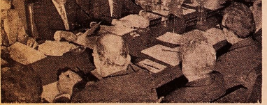
تشکیل کمیته امورا اجتماعی سازمان عمران منطقه ای

هشتمین اجلاس کمیته امور اجتماعی سازمان همکاری عمران منطقه ای در یزد در تهران با شرکت هیئت های نمایندگان ایران پاکستان و ترکیه گشایش یافت رئیس کمیته امورا اجتماعی و معاون وزارت اطلاعات که ریاست این اجلاس را به عهده دارد در نطق افتتاحیه خود سخنرانی کرد و در خصوص گشایش این اجلاس و تشکیل کمیته امورا اجتماعی سازمان عمران منطقه ای