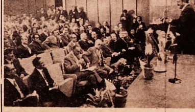
مهندس روحانی در حال صحبت در گشایش کنفرانس بیسن المللی برای خرید جفندز در دانشکده کشاورزی کرج

برای بسی بردن به ارزش و بیدار شدن شایسته ای باشد به دوران فعالیت یکماه گذشته