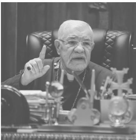
Յաւօր, վերջին օրերին հերթական անգամ ականատես եղանք Իրանի դէմ թշնամական սիոնիստական վարչա-

կարգի ուժգործութեանը, որի ընթացքում Դանակոտում Իրանի հիւսկատուութեան շէնքում նահատակեցին պարտադրած պատերազմի ժամանակաշրջանի մի շարք վետերան գեներալներ եւ Իրանի Իսլամական Հանրապետութեան համակարգի այլ ռազմական խորհրդականներ ու կցորդներ: