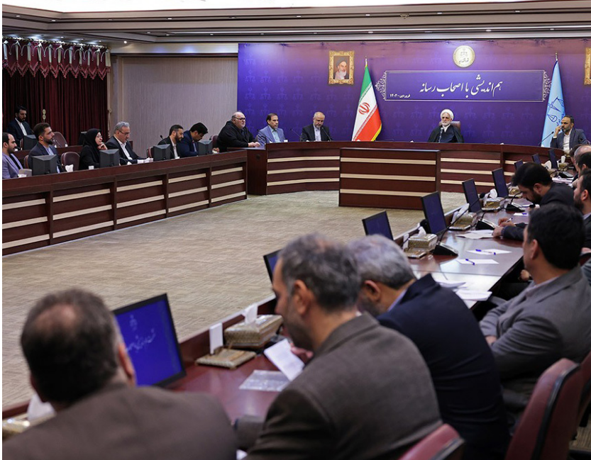
ادامه از صفحه قبل

دیدگاه‌های متنوع بودند که در چارچوب وفاق و پایبندی به نظام اسلامی بیان می‌شد. وی اظهار کرد: از نکاتی که از جانب رئیس قوه قضاییه مطرح شد و پیام اخلاقی مهمی برای جامعه رسانه‌ای و دیگر صنوف داشت این بود که رئیس دستگاه قضا به «میزان الغیر» بودن تأکید داشتند و این که چگونه بتوانیم خود را ملاک و معیار حال دیگران قرار دهیم؛ به این معنی که اگر یک مسئول یا هر کنشگر رسانه‌ای جای خود را با دیگری عوض کند؛ آیا در کنش و رفتار او تفاوت ایجاد می‌شود یا همان رفتاری را خواهد داشت که در موقعیت سابق از او سر می‌زده است.