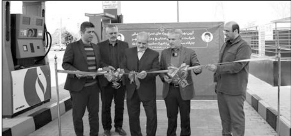
تهران و شرکت ساماندهی صنایع و مشاغل شهر در مناطق ۱۵ و ۱۶ تهران افتتاح شد.

وی در پایان اظهار داشت: جایگاه‌ها به‌صورت ثابت است و بر اساس توافق همکاری با شهرداری تهران، پس از ده سال بهره‌برداری توسط شرکت pido به‌عنوان سرمایه‌گذار این طرح، این جایگاه‌های سوخت تحویل شهرداری تهران خواهد شد.