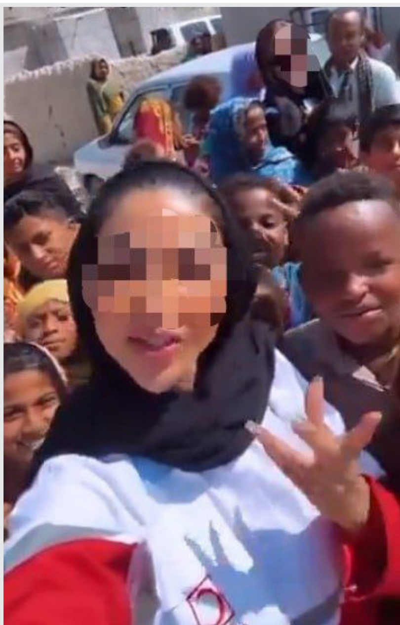
تأملی بر حضور بلاگرها در عرصه های مهم اجتماعی

دیگر فاجعه بزرگی که در روزهای اخیر توسط اینفلوئنسر ها رقم خورد، حضور بلاگرهای عرصه آرایش و زیبایی در میان مردم سیل زده استان سیستان و بلوچستان بود. فارغ از این که یک بلاگر محصولات آرایشی اصلان جا چه می کند و کدام دست باری را می تواند به سوی این مردم نجیب دراز کند، لحن زنده خانم اینفلوئنسر که درباره رنگ پوست بچه های سیستان نطق می کرد، موجی از دل آزدگی را در میان مردم ایران برانگیخت. در یک دنیای آزاد هر کسی می تواند شخصا به تبلیغ هر کالایی که مجوز فروش دارد، بپردازد؛ اما این رفتار دقیقا به معنی کره گرفتن از آب در یک فضای پرغصه