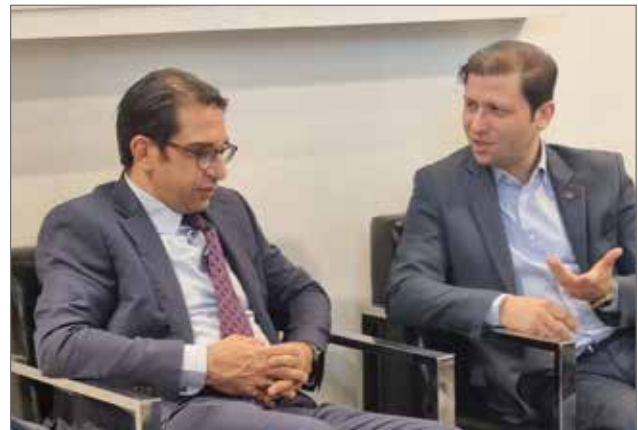
● حضور نماینده ها کوپیان (واحد نمونه صادرات) در غرفه مهیا - اکسپو ۲۰۲۴