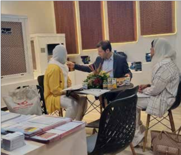
● نشست تجاری با تجار عمان در نمایشگاه اکسپو ۲۰۲۴ - غرفه مهیا