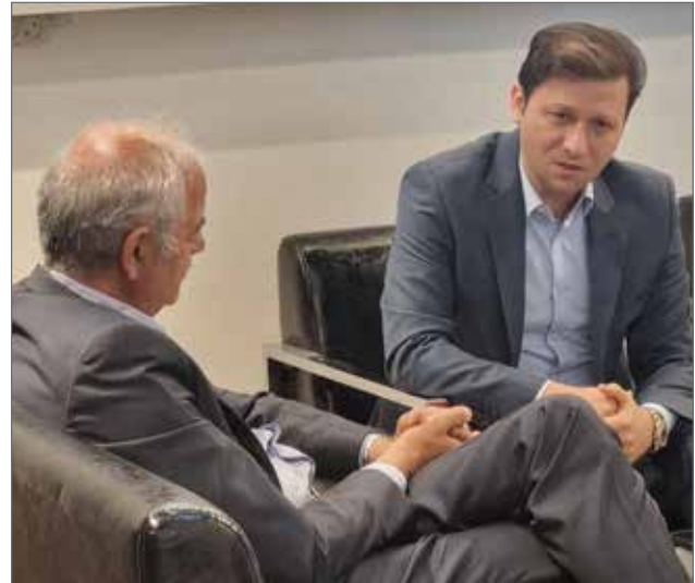
● حضور پیشکسوتان صنعت و تولید در غرفه مهیا - اکسپو ۲۰۲۴