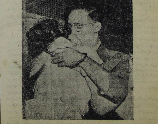
فاشیستهای امریکائی برای زهر چشم گرفتن از آزادیخواهان صلح دوستان امریکا میخواهند امروز این زن و شوهر شرافتمند را اعدام کنند در صفحه ۴

بناسبت گشایش دوره جدید شورای جهانی صلح بی مورد نیست با فردیک ژور-لیو کوری رئیس (شورای جهانی صلح و رجل نامدار و فعال راه صلح آشنا شویم. فردیک ژولیو کوری در پاریس در ۱۹۰۰ مارس ۱۹۰۰ بدنیا آمد تحصیلاتش را در مدرسه فیزیک و شیمی صنعتی شهر پاریس در رشته مهندسی پایان رسانید. در سال ۱۹۲۵ بدستباری مادام کوری در انستیتیو رادوم انتخاب شد. در سال ۱۹۲۷ از دانشگاه پاریس لیسانس علوم گردید در سال ۱۹۳۰ نیز دوره دکترای علوم را گذراند و در سال ۱۹۳۲ به سمت دانشیار دانشکده علوم پاریس منصوب شد و یکسال بعد بریاست تحقیقات مرکز ملی مطالعات علمی رسید. در همان سال که صاحب کرسی کنفرانس در سوربون شده بود همراه زنش ایرن ژولیو کوری که از یهودیان لهستانی میباشد پذیرفت جایزه بین المللی نوبل نائل گشت در سال ۱۹۳۷ به سمت استادی کواژدو فرانس و مدبر لایبراتورار نر بیات اتمی انتخاب شد. در سال ۱۹۴۳ در حالیکه مخفیانه با قوای اشغالگر هیتلر و عوامل آن نبردمی کند بعضویت آکادمی پزشکی انتخاب میگردد. بلافاصله پس از آزادی پاریس اداره مرکز تحقیقات علمی را بعهده می گیرد. بقیه در صفحه ۴