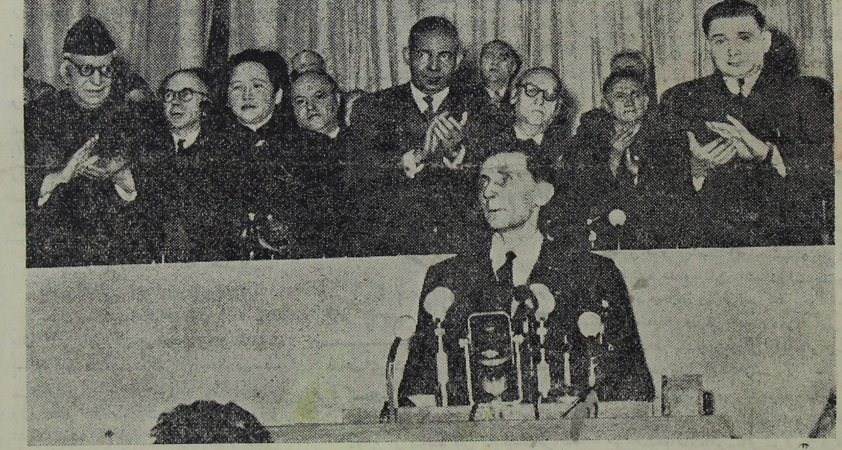
پرفسور ژولیو کوری هنگام نطق در یکی از جلسات شورای جهانی صلح

امروز بشریت مرقی از تصمیم و عمل تنگین و جنایت بار دادگاه بی عدالت دولت سرمایه داری امریکا در مورد اعدام دو دانشمند شریف بشریت «روزنبر گها» این زن و شوهر از زنده و عدالتخواه خشکیست است. از پنهنه کیتی فریاد اعتراض آمیز صدها میلیون از مردم صلح دوست جهان نسبت به بی عدالتی و نفرت انگیز دولت خونخوار و افسان کش امپریالیستی امریکا با انزجار کامل بلند است. سرمایه داری آمریکادریز فشار مبارزات آزادیخواهان، استقلال طلبی، صلحخواهی و بشر دوستی صدها میلیون مردم شریف در حال بر زمین افتادن است چاره خود را این میبینند که از خون بیگناهان خود را سیراب کنند. و برای بقای عمر کوتاه و نیکت با خود از کشور کرگرفته تاهند و چین و ایران، و ترکیه و یونان و تونس و مراکش خلقهای صلح طلب را بخون بکشند. این درنده خون آشام نمیتواند مردم جهان را در صلح و صفا و آرامش بگذرد مجبور است در هر گوشه ای از جهان بیبانه و عنوان ظالمانه ای بیگناهان را به بند کشد و خون آنها را بریزد. بقیه در صفحه ۴