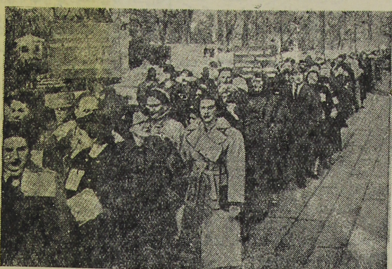
مردم بشردوست نیویورک با نمایشات اعتراض آمیز خود آزادی روز نبر گهارا را طلب می کنند

هزاران نفر از مردم امریکا در برابر کاخ سفید واشنگتن به تظاهرات پرداخته اند برای آزادی روز نبر گهارا دست زدن در امریکا کمیته مخصوصی تشکیل شده است