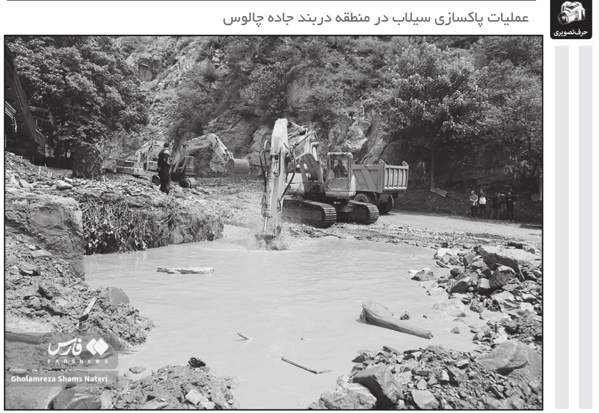
عملیات پاکسازی سیلاب در منطقه دربند جاده چالوس

گفتنی است: برپایی پوشش های تخصصی - مسابقه های فرهنگی هنری - تجلیل از پژوهشگران فعال در حوزه دفاع مقدس - برگزاری آئین رونمایی از کتاب های تازه چاپ شده حوزه دفاع مقدس ویژه مخاطبان کودک و نوجوان - تولید تئاتر خیابانی برای مخاطب کودک و نوجوان در حوزه دفاع مقدس - تولید موشن گرافی در حوزه دفاع مقدس برای مخاطب کودک و نوجوان - تهیه بازی های رایانه ای با موضوع معرفی قهرمانان ملی و استانی - معرفی شخصیت شهدای استان به کودکان و نوجوانان و تجلیل از فرزندان کودک و نوجوان شهدای سلامت استان - برگزاری مهرواره شعر سرایی شعرا آئینی استان - برگزاری مسابقات کتابخوانی و برگزاری کارگاه نقد و بررسی کتاب برخی دیگر از برنامه های محوزی این کارگروه هستند.