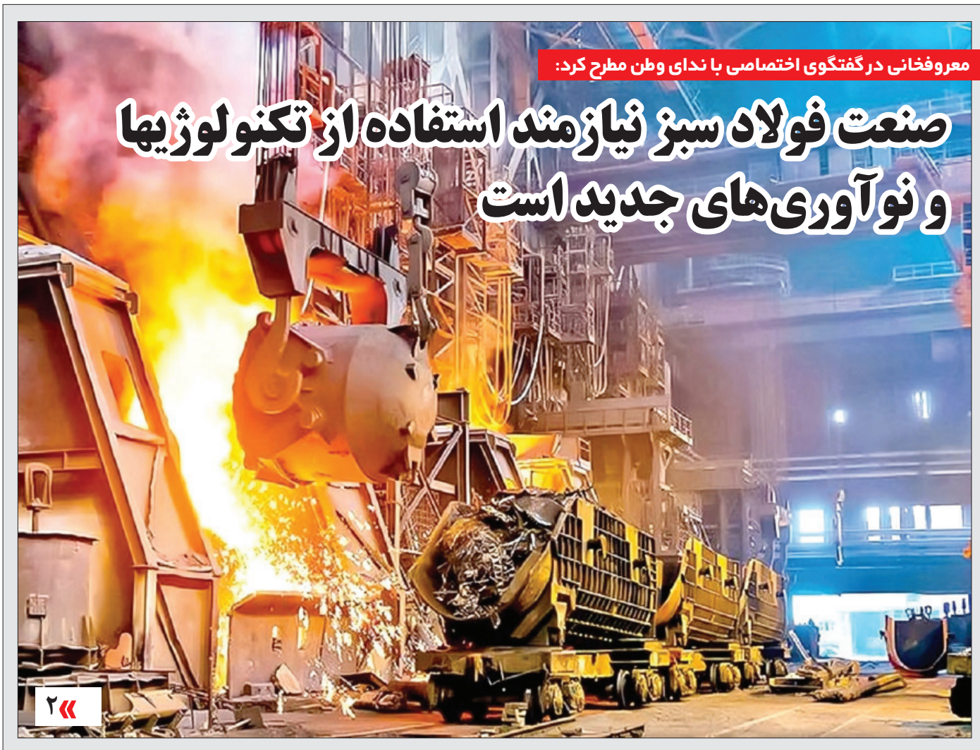
معروفخانی در گفتگوی اختصاصی با ندای وطن مطرح کرد: