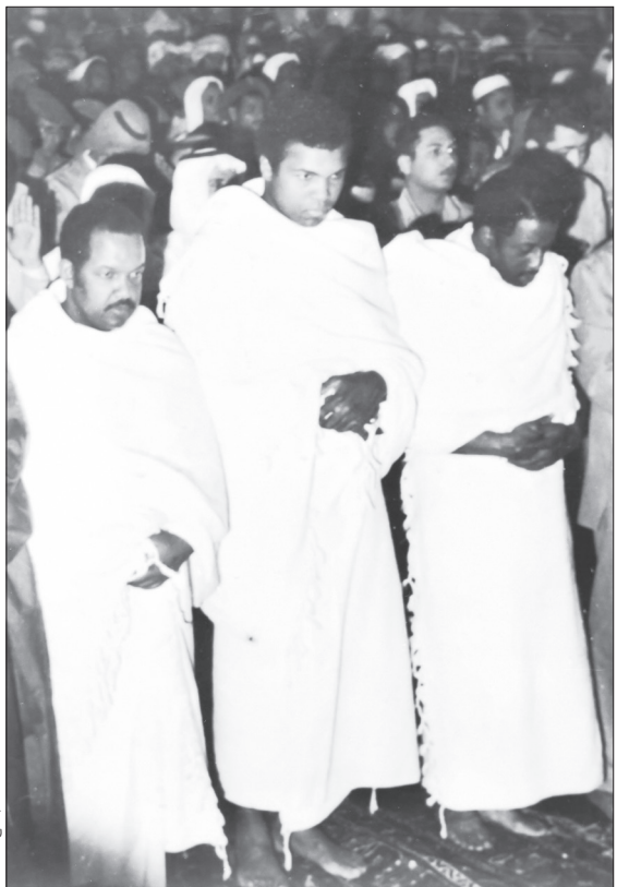
محمد علی در مراسم حج ۱۹۷۴

[شهروند] «من لحظات بسیار زیبایی را در زندگی تجربه کردم. اما ناب‌ترین احساسم در لحظه‌ای بود که هنگام مناسک حج در صحرای عرفات ایستادم. احساس من در آن فضا وصف‌ناپذیر است. یک نیم میلیون زائر برای طلب بخشش و شکر نعمت‌هایی که خدا به آنان عطا کرده با اشک و زاری در صحرا جمع شده بودند. این تجربه‌ای هیجان‌انگیز برای من بود وقتی که می‌دیدم افراد از تمامی رنگ‌ها، نژادها، ملیت‌ها، پادشاهان، سران قدرت و مردمان عادی از کشورهای فقیرنشین همگی با دو تکه پارچه سفید ملیس شده و فارغ از هرگونه حس غرور یا حقارت به نیایش با الله مشغولند. این جلوه‌ای عملی از مفهوم برابری در اسلام بود...» جملاتی که خواندید بخشی از یک سخنرانی محمد علی (کلی)، مشهورترین مشت‌زن تاریخ بوکس سنگین وزن جهان است که ۸ سال پیش، برابر ۳ ژوئن ۲۰۱۶ میلادی، پس از سال‌ها دست و پنجه نرم کردن با بیماری پارکینسون در ۷۴ سالگی درگذشت.