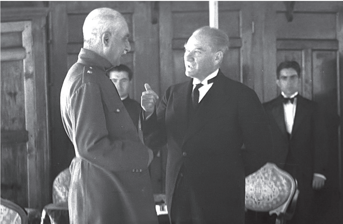
مصطفی کمال پاشا امیران‌الدین و آخرین سفر خارجی رضاشاه - ۱۳۰۳