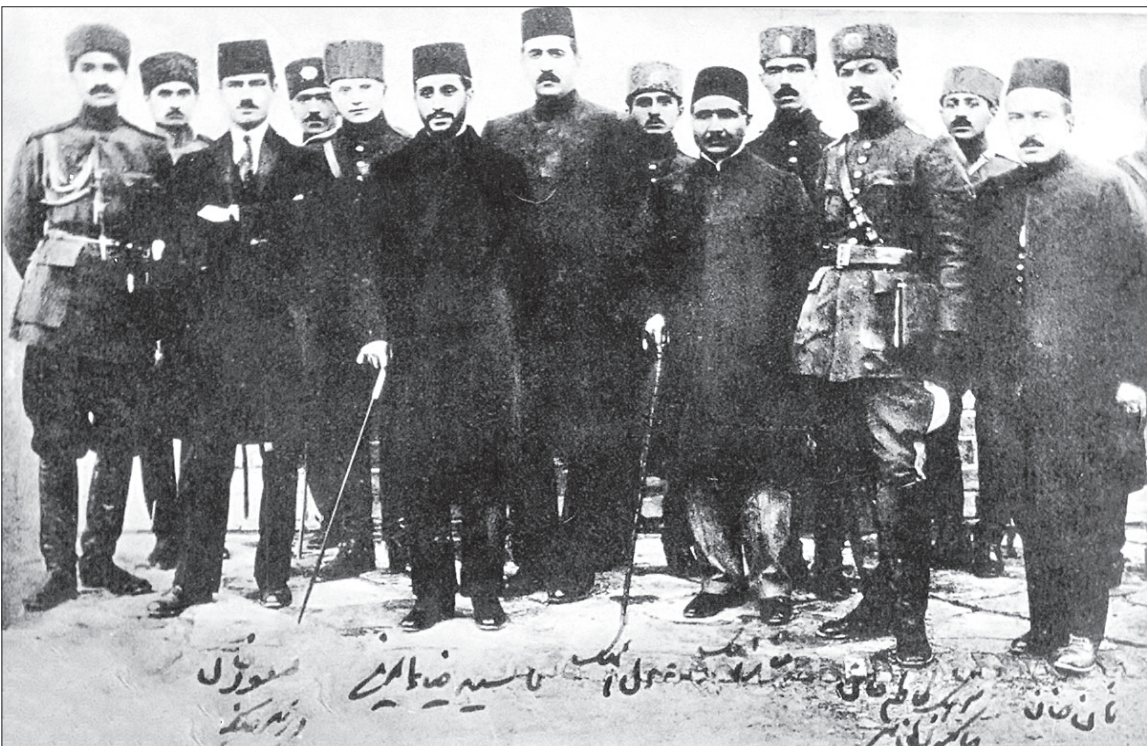
سیدضیاءالدین طباطبائی و جمعی از عوامل کودتای سوم اسفند ۱۳۲۹