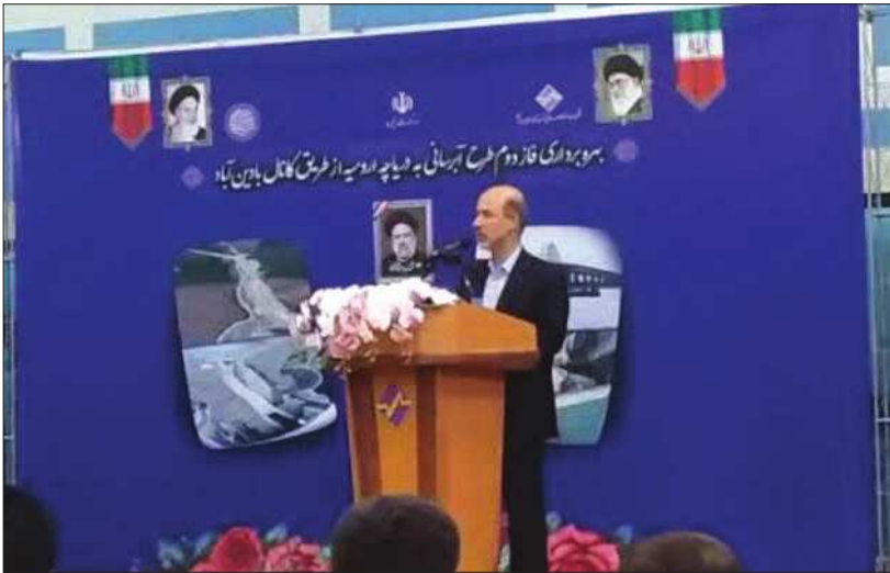
وزیر نیرو و گفت: دریاچه ارومیه بهترین منبع حیات در شمال غرب کشور بوده و احیای آن علی‌الکبر محرابیان ۱۴ تیرماه در آیین بهره

برداری از از فاز دوم طرح آبرسانی به دریاچه ارومیه از طریق کانال بادین آباد گفت: با بهره‌گیری از مدیریت آب، بخشی از اهداف احیای دریاچه ارومیه را محقق کردیم و از این به بعد سالانه شاهد افزایش تراز دریاچه ارومیه خواهیم بود. وی اظهار کرد: خشک شدن دریاچه ارومیه حیات استان‌های همجوار و بخش قابل توجهی از کشور را با تهدید جدی رو برو می‌کند، لذا مدیریت منابع آب منطقه برای احیای دریاچه ارومیه به اولویت دولت سیزدهم تبدیل شد. وی خاطرنشان کرد: احیای دریاچه ارومیه نه تنها به حفظ محیط زیست و اکوسیستم منطقه