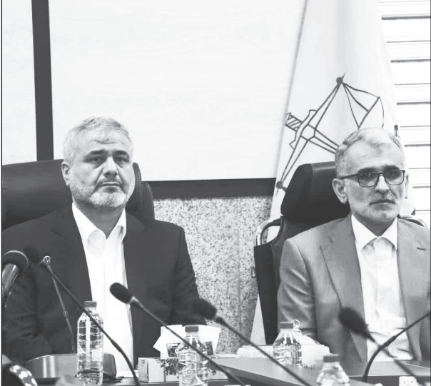
این ایام همراهی و تعاملات آنها در دسترهای مختلف منجر پیشبرد امورات متعدد شده است. وی افزود: در حالی انتخابات ۸ تیرماه را پشت سر

رئيس دادگستری بودیم که این امر در انتخابات ۱۱ اسفندماه سال گذشته نیز مسبوق به سابقه بوده، همین موضوعات در کنار فعالیت دیگر عوامل دست اندرکار منجر به برگزاری انتخاباتی در کامل آسایش و امنیت در سطح شهرستان قدس شد. فرماندار شهرستان قدس با بیان اینکه در حوزههای مختلف نظیر مبارزه با فاسد شاهد همت دستگاه قضایی هستیم، ادامه داد: یکی از مشکلات موجود در بحث کمبود بودجه است اما یکی از سیاستهای دولت سیزدهم توجه به زیرساختها می باشد به طوری که با همراهی مجموعه مدیریت شهری و شورای اسلامی شاهد توسعه سرانههای مختلف در سطح شهرستان قدس بوده و هستیم. مقام عالی دولت در شهرستان قدس تصریح کرد: زمان ساخت این ساختمان در کمتر از ۱۰ ماه صورت گرفت که مورد بهره برداری قرار خواهد گرفت، همچنین امید است با تاسی از اهل بیت عصمت و طهارت (ع)، آرمانهای امام راحل و شهدای عظیم الشان و لیبیک به فرامین مقام معظم رهبری (مدظله العالی) در امتداد مسیر شهدای خدمت و دستگاه قضایی امانت داری مناسبی در سنگر خدمت به مردم باشیم.