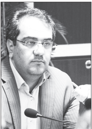
استان تهران از عوامل اجرایی ستاد سفر شهرداری تقدیر کرد.