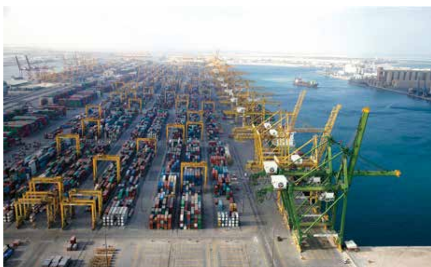
ميناء «جبل علي» يلعب دوراً نشطاً في التجارة بين إيران والإمارات

والتبادلات التجارية والعلاقات السياسية والاقتصادية الطويلة الأمد ووجود مناطق حرة واقتصادية قد وفرت هذا المستوى من التعاون. وذكر: في السنوات الست الماضية، تزايدت التبادلات المالية بين إيران والإمارات، وحدث تغيير كبير مقارنة بالسنوات السابقة؛ بالإضافة إلى ذلك، وقعت طهران وأبوظبي الشهر الماضي إتفاقية اقتصادية لإشراك القطاع الخاص الإيراني في التجارة، وكان من المقرر إبرام مذكرة التفاهم هذه منذ عدة سنوات، والتي تم