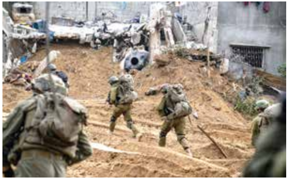
وتقصف مقر قيادته في «نتساريم»