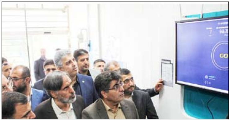
افتتاح پروژه ملی فیبر نوری