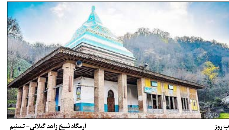
آرگاه شیخ زاهد گیلانی - تسنیم قلاب روز