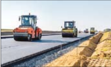
اجرای ۴۰ متر عرض راهداری در قالب چله خدمت

چهارمحال وبختیاری از جمله استان هایی به شمار می آید که در مدت سه سال حضور و فعالیت دولت سیزدهم شاهد اجرا و به نتیجه رسیدن پروژه‌های زیادی در عرصه‌های مختلف بود. بر همین اساس و همزمان با چله خدمت، انجام ۴۰ پروژه مرتبط با راهداری و حمل‌ونقل جاده‌ای این استان در دستور کار قرار گرفت تا با خدمات‌رسانی سریع‌تر به مردم راه‌رتیس جمهور شهید ادامه یابد.