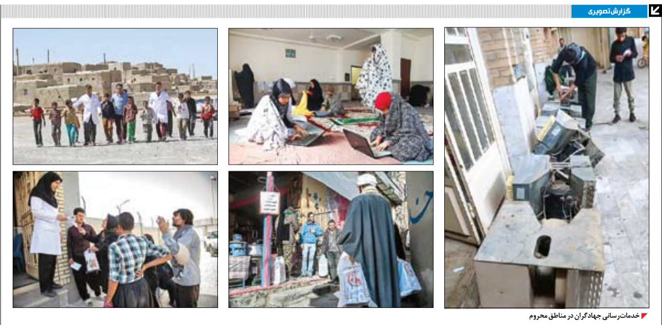
خدمات رسانی جهادگران در مناطق محروم

بسیج در سال‌های اخیر با ارائه وام‌های اشتغالزایی و حمایت از تولیدکنندگان توانسته است از مشاغل زودباز به حمایت‌های خوبی انجام دهد و چرخ تولید و اقتصاد کشور را به چرخه در بیاورد. بسیج سازندگی که از نیروهای تازه‌نفس بسیجی تشکیل شده از زمان تشکیل آن تاکنون هر مکانی که نیاز به حضور جوجوش و مردمی بوده حضوری بر رنگ و مفید داشته است. جهادگران در بسیج سازندگی زمان و مکان برای کمک‌کردن نمی‌شناسند و پراشتغال فرقی نمی‌کنند. در بحران‌ها و مواقع اضطراری نیروهای جهادی و بسیجیان در خط مقدم یاری رساندن قرار دارند و این بحران‌ها می‌خواهد سیل و زلزله باشد یا ساختن خانه محرومی چند هفته پیش ۲۰ مسکن مددجویان کمیته امداد امام خمینی (ره) در شهرستان بندرعباس و سیریک افتتاح و ۵۰ مورد نیز در شهرستان‌های بندرعباس و بناگرد مرمت شد. ۲۰ کیلومتر جاده بین مزارع در شهرستان حاجی‌آباد افتتاح شده و یکی از اقدامات بسیج سازندگی ارائه خدمات به کشاورزان برای چرخش تولید است. این خدمات می‌تواند برای توسعه