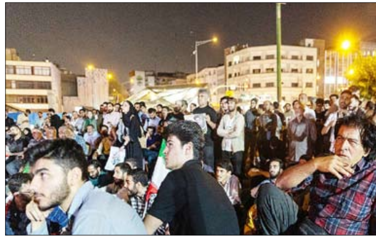
پخش اولین مناظره دور دوم انتخابات ریاست جمهوری - مهر قاب روز

در تغییر ذائقه هنری و سلیقه فرهنگی مخاطب فرانسوی در مواجهه با محصولات فرهنگی، به ویژه هنری بسیار تاثیر گذار بوده است. نکته نماند اجرای هر اثر هنری حتی با کیفیت متوسط، برای مردمان کشوری که صبغه فرهنگی و هنری دارند و مخاطبانش آشنا و آگاه با آثار فاخر هستند، یک خطای مطلق محسوب می شود. اما برای کشوری همچون ایران که به تکرار در فضای فرهنگی فرانسه علیه اش اقدام می شود و فرصتی برای نشان دادن توانمندی های خود ندارد، نمی توان چنین خطری کرد. در سایر حوزه ها نیز کیفیت محصول و جذابیت آن بر مبنای سلیقه مخاطب فرانسوی بسیار مهم است. البته این جذابیت ها بر اساس دسته بندی محصول، تعاریف و ویژگی های متفاوتی دارند.