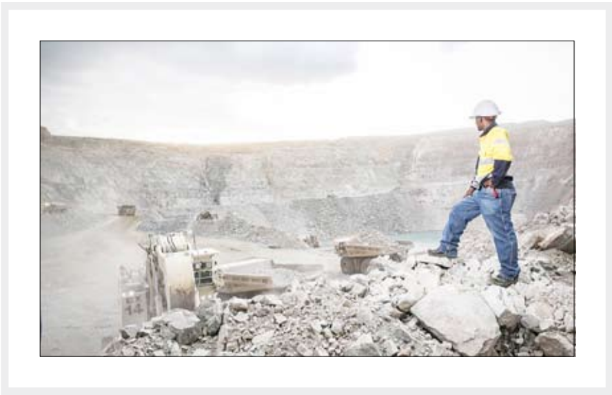
کارکنان معدن در آفریقا

در صنعت فولاد استفاده می‌شود حتی از سهم عظیم آن در ذخایر فلزات جهان چشمگیرتر است؛ تقریباً ۹۰ درصد ذخیره جهانی کروم و تیتانیوم در جنوب آفریقا و میزان کمتری از آن در غرب و شمال شرق آفریقا وجود دارد. جالب است که بدانید، روسیه در سال‌های اخیر فعالیت گسترده‌ای در معان آفریقا داشته و همچنان معدنچیان روسیه در حال سرمایه‌گذاری قابل توجهی در حوزه فعالیت فلزی و مواد معدنی در آفریقا دارند. روسیه در پروژه‌هلی منابع انرژی کامرون، کنگو، غنا، موزامبیک و نجریه مشارکت دارند و همچنین در معادن مختلف مانند آنگولا، گینه، نیجریه، سودان و زیمبابوه سهم دارند. در این رابطه مدیر امور بین‌الملل ایمیدرو گفته است: عربستان سعودی و چین با سرمایه‌گذاری کلان و اتکا به نفوذ سیاسی خود، در حال به دست آوردن سهم قابل توجهی از بازار معادن قاره