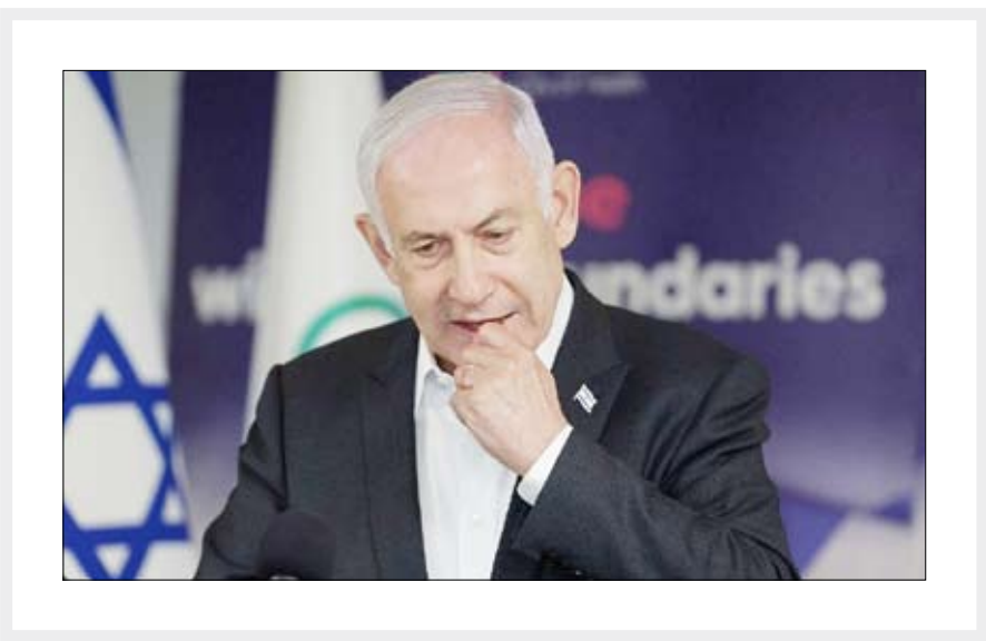
فاش نشود، آتش بس با حماس همچنین می‌تواند دستیابی به

نتانیاھو نگران آتش‌بسی است که حماس را در قدرت نگه می‌دارد، زیرا این نتیجه می‌تواند منجر به فروپاشی ائتلاف او شود. بخش‌هایی از این ائتلاف گفته‌اند در صورت پایان جنگ با شکست‌ناپذیری حماس، از آن خارج خواهند شد. تا همین اواخر، ارتش علنا می‌گفت که امکان دستیابی هم‌زمان به ۲ هدف اصلی جنگی دولت وجود دارد: شکست حماس و نجات اسرائیلی که از هفتم اکتبر تاکنون در غزه هستند. اکنون، چند ماه پس از شروع تردید ژنرال‌ها، فرماندهان ارشد نظامی به این نتیجه رسیده‌اند که این ۲ هدف با یکدیگر ناسازگار هستند. فرماندهان ارشد نظامی اسرائیل پس از ۹ ماه جنگ به این نتیجه رسیده‌اند که شکست حماس و نجات اسرائیل با یکدیگر ناسازگار هستند. فرماندهان ارشد همچنین بیم آن دارند که اقدام نظامی بیشتر برای آزادی اسرائر ممکن است خطر کشتن سایرین را به دنبال داشته باشد. نیویورک تایمز ادامه داد: پس از گذشت نزدیک به ۹ ماه از آغاز جنگ غزه که اسرائیل برای آن برنامه‌ریزی نکرده بود، ارتش آن با کمبود قطعات یدکی، مهمات، انگیزه و حتی نیرو مواجه است. این جنگ شدیدترین نبردی است که اسرائیل حداقل در چهار دهه گذشته انجام داده است. و طولانی‌ترین جنگی است که تا به حال در غزه انجام داده است. در ارتشی که عمدتاً به نیروهای ذخیره خود متکی است، برخی از نیروها در سومین دوره خدمت خود از اکتبر هستند و برای متعادل کردن جنگ با تعهدات حرفه‌ای و خانوادگی‌شان به سختی تلاش می‌کنند.