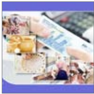
امداد وام‌های قرض‌الحسنه و تسهیلات حمایتی بانک صادرات ایران در سه ماه ابتدای سال ۱۴۰۳

تعداد وام‌های قرض‌الحسنه و تسهیلات حمایتی بانک صادرات ایران در سه ماه ابتدای سال ۱۴۰۳ برای کمک به مردم اقصدی نقاط کشور از مرز ۸۰هزار فقره گذشت.به گزارش تجارت به نقل از روابط عمومی بانک صادرات ایران، پرداخت وام‌های حمایتی از محل منابع قرض‌الحسنه و تسهیلات از محل منابع عادی این بانک در بخش‌های مختلف اقتصاد مقاومتی در سه‌ماه ابتدای سال ۱۴۰۳ با سرعت بیشتری ادامه یافت و مجموع تعداد این پرداخت‌ها به ۸۰ هزار و ۲۰۰ فقره رسید و بیش از ۱۲۰ هزار میلیارد ریال توسط بانک به آن تخصیص یافت. بنابراین گزارش، عملکرد وام‌های قرض‌الحسنه بانک صادرات ایران در فصل بهار سال جاری نشان از پرداخت ۵۴هزار و ۷۶۲فقره انواع وام‌های قرض‌الحسنه به ارزش ۸۳هزار و ۴۹۷میلیارد ریال دارد. علاوه بر این ۲۵ هزار و ۴۳۷ فقره تسهیلات تکلیفی از محل منابع عادی به ارزش ۲۶ هزار و ۷۲۱میلیارد ریال به متقاضیان در قالب اقدام ملی مسکن، ودیعه مسکن اقدام ملی، مسکن روستایی و مسکن اپنار گران به معرفی شدگان پرداخت شده که در مجموع ۸۰ هزار و ۲۰۰ فقره تسهیلات حمایتی به ارزش بیش از ۱۲۰ هزار میلیارد ریال به واجدان شرایط پرداخت شده است.