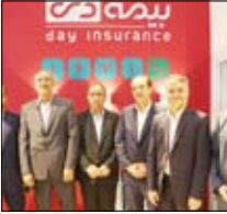
بازدید مدیران ارشد صنعت بیمه از غرفه بیمه دی در نمایشگاه ال‌کامپ

شرکت بیمه دی در بیست و هفتمین دوره نمایشگاه ال‌کامپ، با برپایی غرفه در سالن ۱۷ این نمایشگاه، به ارائه محصولات و دستاوردهای نوین خود در زمینه بیمه‌گری دیجیتال پرداخته و میزبان مدیران ارشد صنعت مالی کشور بود.به گزارش تجارت به نقل از روابط عمومی و‌ام‌وربین الملل بیمه‌دی، طی روز های برگزاری این نمایشگاه، مدیران ارشد صنعت بیمه ضمن حضور در نمایشگاه از غرفه شر کت بیمه دی نیز بازدید کردند. این نمایشگاه از نهم تا یازدهم تیرماه برگزار شد. همچنین مدیران و کارشناسان این شرکت با حضور در غرفه پاسخگوی مخاطبان این نمایشگاه هستند.