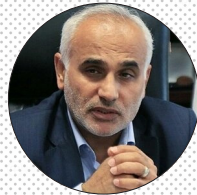
دکتر حسین فرشیدی

معاون بهداشت وزارت بهداشت ضمن تشریح اقدامات انجام شده در جهت تقویت شبکه بهداشت و درمان شهری کشور و همچنین گسترش برنامه سلامت خانواده به کل کشور، گفت: طبق برنامه‌ریزی‌های انجام شده مقرر شده که تا پایان امسال کل جمعیت شهری کشور یعنی معادل ۲۸ میلیون نفر دیگر نیز به برنامه سلامت خانواده بپیوندند. دکتر حسین فرشیدی در گفت‌وگو با ایسنا، شبکه بهداشتی و درمانی کشور را از دستاوردها و افتخارات انقلاب اسلامی خواند که در کنترل بیماری‌ها و افزایش چشمگیر شاخص‌های بهداشتی نقش بی‌بدیلی داشته و در عین حال در تشریح اقدامات انجام شده جهت تقویت شبکه بهداشت و همچنین اجرا و گسترش برنامه پزشک خانواده، گفت: در حال حاضر ۹۷ درصد جمعیت روستایی کشور تحت پوشش برنامه پزشکی خانواده هستند و از این طریق با شبکه بهداشتی و درمانی کشور در ارتباطند. اقدامات وزارت بهداشت برای تقویت شبکه بهداشت و درمان شهری