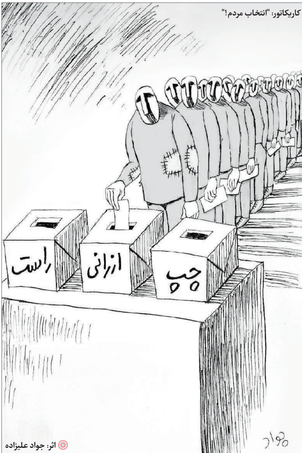
کاریکاتور: "انتخاب مردم!"