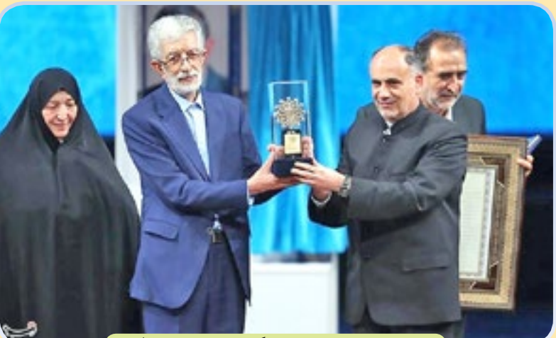
مراسم نکوداشت دانشمند گرمای غلامعلی حداد عادل