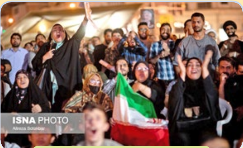
تماشای دومین مناظره دور دوم چهاردهمین دوره انتخابات ریاست جمهوری