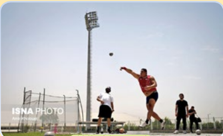
اردوی تیم دوومیدانی کم‌بینایان ایران