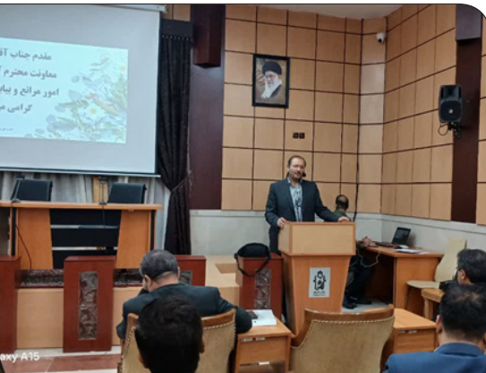
معاون آبخیزداری، امور مراتع و بیابان سازمان منابع طبیعی و آبخیزداری کشور در مشهد در حال برگزاری است.

گفتنی است شعار روز جهانی مقابله با بیابانزایی و خشکسالی امسال، (اتحاد برای سرزمین - میراث طبیعی ما، آینده ما) است و به همین مناسبت دوره آموزشی دو روزه با حضور معاونین فنی و روسای ادارات امور بیابان ادارات کل منابع طبیعی و آبخیزداری استان‌های بیابانی کشور با هدف هم‌اندیشی و تبادل تجارب موفق استان هادر زمینه بیابانزایی، چهارشنبه ۱۳ و پنجشنبه ۱۴ تیر ماه در مشهد در حال برگزاری است.