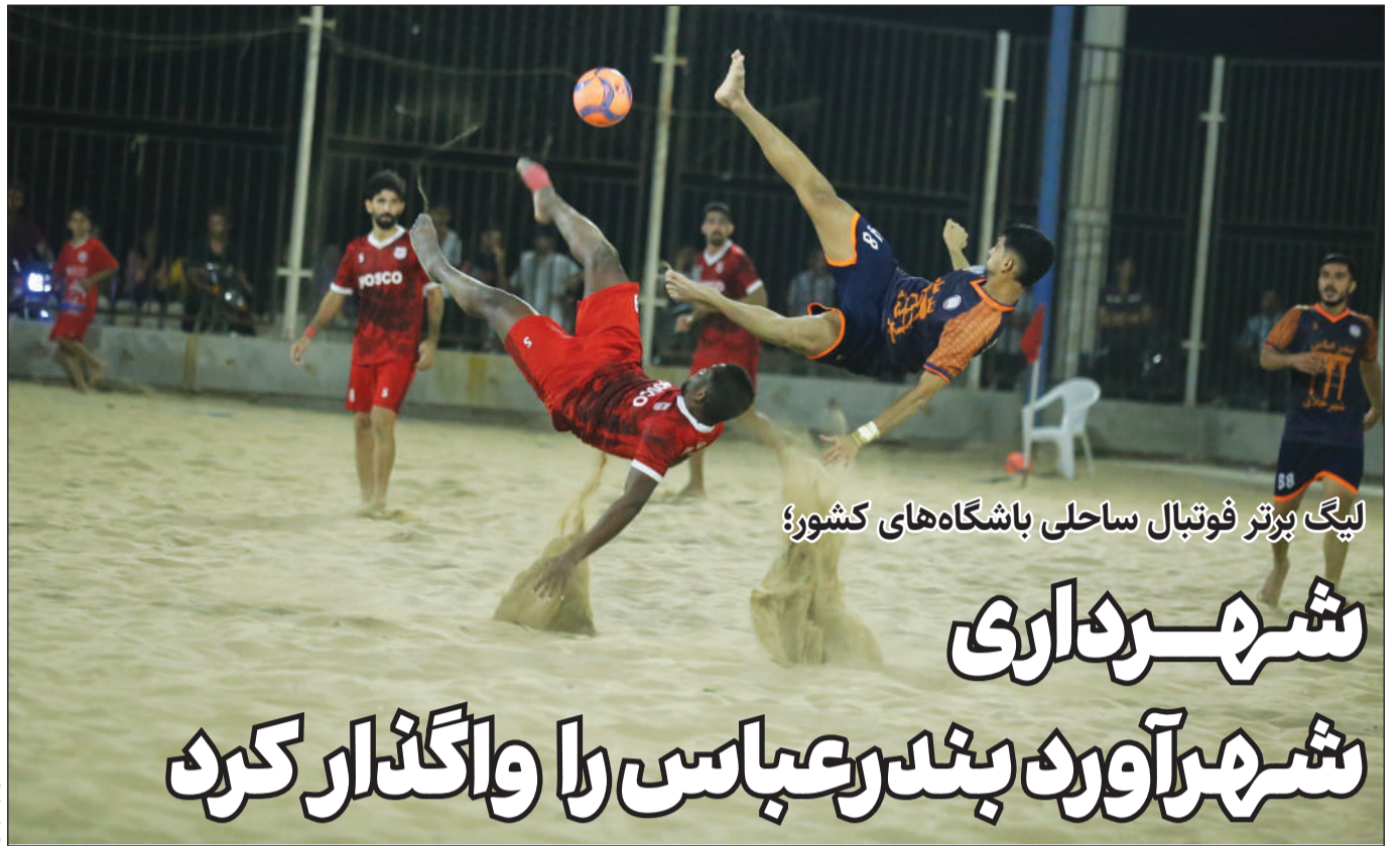
لیگ برتر فوتبال ساحلی باشگاه‌های کشور؛