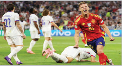
■ راهبایی اسپانیا به مسابقه فینال یورو