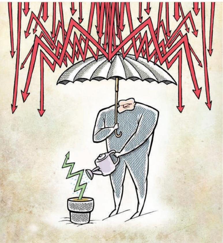
ریزش بورس ادامه دارد