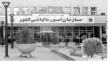
سید محمدهادی سبحانین، رئیس کل سازمان امور مالیاتی کشور یکی از مهم‌ترین مواردی را که می‌تواند به جامعه‌پذیر کردن امر مالیات ستانی در کشور و تمکین مؤدیان در پرداخت مالیات منجر شود، ایجاد شفافیت و آگاهی مؤدیان نسبت به محل مصرف مالیات پرداختی ایشان و سهم دانستن آنها در فرایند آبادانی و پیشرفت کشور عنوان کرد و اظهار داشت: بدین ترتیب مردم از مالیات پرداختی خود احساس رضایت و توسعه می‌دانند. رئیس کل سازمان امور مالیاتی کشور با اشاره به تصویب و ابلاغ پروژه مهم ایجاد امکان برای مردم مشتک به تعیین محل هزینه کرد مالیات‌های

وی تصریح کرد: تأمین منابع عمومی را فراهم خواهند کرد از محل مالیات‌های پرداختی مؤدیان و به انتخاب و انتخاب ایشان صورت می‌گیرد و پروژه‌ها نیز شامل پروژه‌های هستند که حداکثر منافع عمومی را در سطح ملی و استانی به دنبال دارند و می‌توانند در حوزه‌های گوناگون همچون سلامت، آموزش، راه و ترابری اجرا و تکمیل‌شده. مؤدیان در زمان ارائه فرم تبصره ماده (۱۰۰)، فهرست پروژه‌های استانی و ملی با حداکثر منافع عمومی را مشاهده کرده و می‌توانند از میان آنها پروژه مورد نظر برای تخصیص مالیات پرداختی خود را انتخاب کنند. بر این اساس سازمان امور مالیاتی کشور نیز مکلف است امکان اعلام عمومی نام اشخاص پرداخت‌کننده مالیات را فراهم آورد.