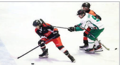
■ دیدار تیم‌های ملی بزرگسالان و جوانان هاکی روی یخ آقاپان