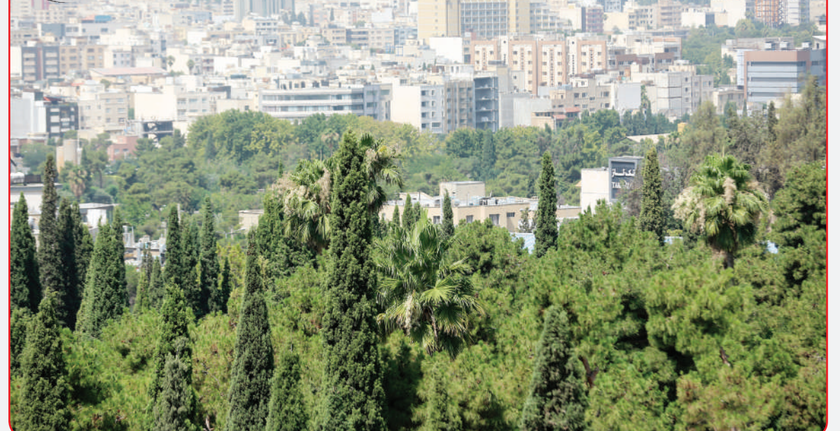
■ آلودگی و غیر بارگرما در تابستان شیراز