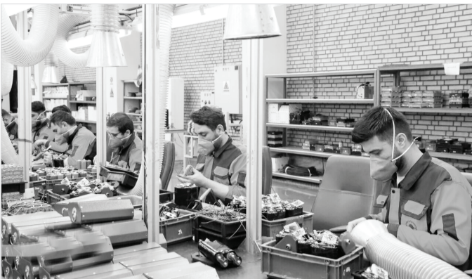
دولت‌های گذشته کمتر داشته است. اشتغال ناقص نشان از این موضوع دارد که

ایرنا- مهم‌ترین دلیل کاهش نرخ بیکاری و آمراهی امیدوارکننده بازار کار در دولت سیزدهم که در هیچ دولتی سابقه نداشت، توجه شهید آیتا... رئیس به مسئله اشتغال بود؛ به همین واسطه در این دولت نرخ بیکاری جوانان ۱۵ تا ۲۴ سال ۲۳/۶ درصد در پایان ۱۴۰۲ به ۲۱/۲ درصد در پایان رسید.