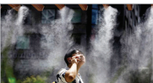
■ آب‌پاش‌های خنک‌کننده - شهر توکیو ژاپن