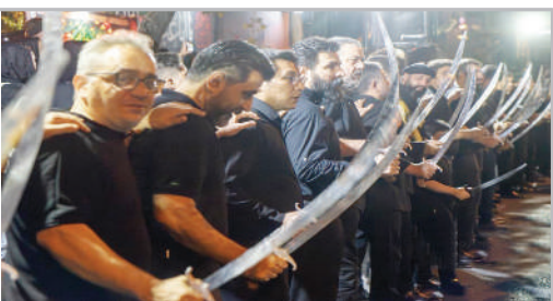
■ مراسم عزاداری «شاه حسین گویان» - تهران