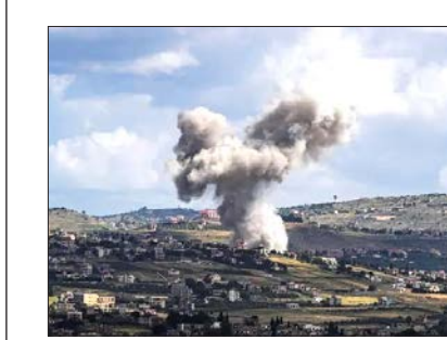
در همین ارتباط، رسانه‌های صهیونیستی نیز بارها اذعان کرده‌اند که حزب... در شمال سرزمین‌های اشغالی فلسطین همچنان دست برتر را دارد و ارتش رژیم صهیونیستی در این منطقه به دام افتاده است.

حزب... لبنان اعلام کرد که تجهیزات جاسوسی دشمن صهیونیست را در شمال فلسطین اشغالی هدف قرار داده است. به گزارش خبرگزاری مهر به نقل از المیادین، مقاومت اسلامی لبنان در بیانیه‌ای اعلام کرد: رزمندگان ما، تجهیزات جاسوسی مرکز مسکاف عام در شمال فلسطین اشغالی را با سلاح مناسب هدف قرار دادند. منابع خبری از برخاستن دود از مسکاف عام به دنبال حمله موشکی مقاومت اسلامی لبنان خبر دادند. از سوی دیگر رسانه‌های رژیم صهیونیستی از آتش سوزی در الجلیل علیا در شمال فلسطین اشغالی خبر دادند که به دنبال حملات موشکی از لبنان رخ داده است.