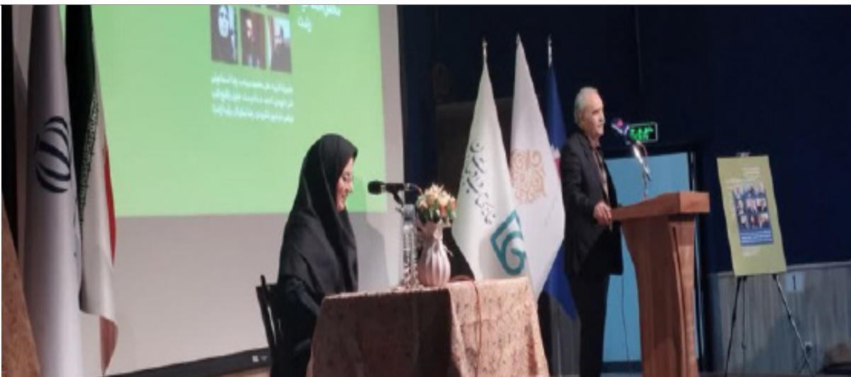
با حضور شاعران ملی و استانی :