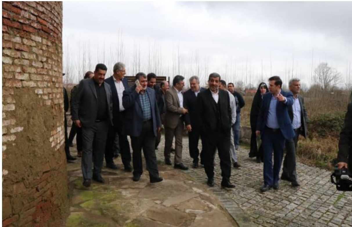
در پی سفر وزیر گردشگری به صومعه سرا؛