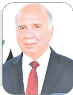
عراق خواهان بازنگری تحریم‌های بانکی ایران