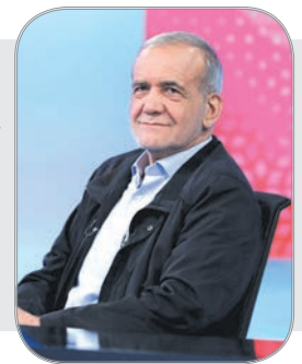
آرای قومیتی؛ اسم رمز جلیلی برای تخریب پزشکیان