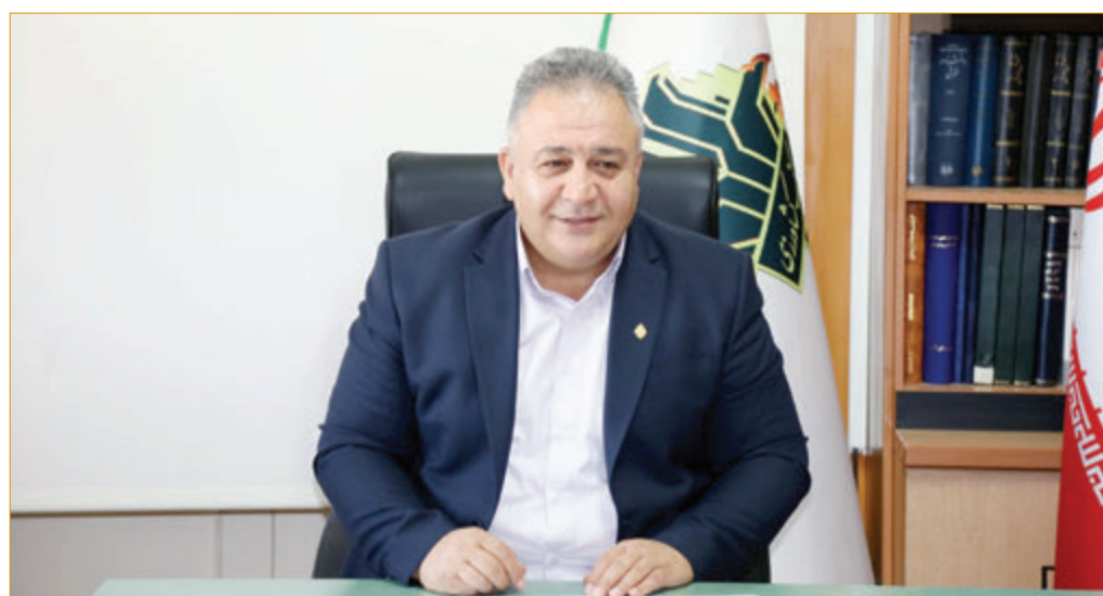
مدیر شعب بانک کشاورزی هرمزگان مطرح کرد؛