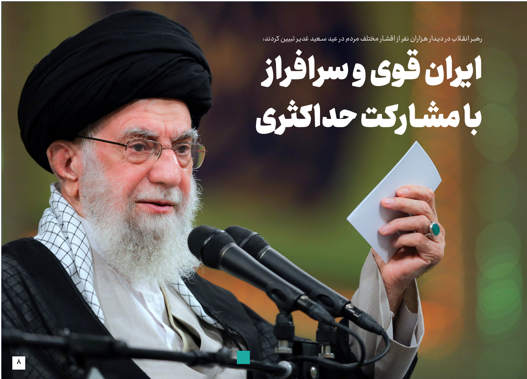
رهبر انقلاب در دیدار هزاران نفر از اقشار مختلف مردم در عید سعید غدیر تبیین کردند: