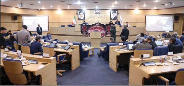
جلسه تأیید نهایی لایحه مقررات

بامصوبه‌شورا، دستورالعمل مقاوم‌سازی بنا منطبق بر آیین‌نامه مقاوم‌سازی ساختمان‌های در برابر زلزله تدوین می‌شود