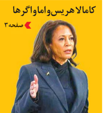
کامالا هریس و اما و اگرها