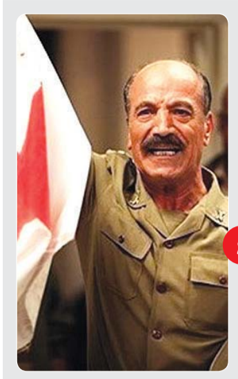
خدا حافظ قهرمان عاشق سینما به بهانه درگذشت سعید راد بازیگر پیش کسوت